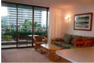
▲スタンダードの眺望例 スタンダードの室内例▶