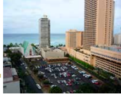
▲高層階からの眺望例

ワイキキ内、バスが走行するクヒオ通り沿い、ダイヤモンドヘッド寄りの立地。ファミリー層の利用が多く、アットホームな雰囲気のコンドミニウム。