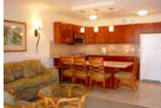
▲デラックスの室内例