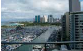
▲ヨットハーバー側

ワイキキ内アラモアナ寄りの、海に面した立地。 アラモアナとワイキキの中ほどにあり、どちらに行くにも便利。 イリカイホテルと同じ建物内で、日本人の割合が少なく、静かなリゾート気分を満喫できます。