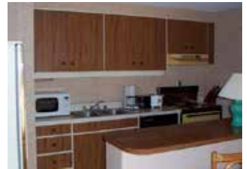
▲キッチン (スタンダード)

室内設備 フルキッチン (冷蔵庫 電子レンジ コーヒーメーカー 炊飯器 皿や鍋) 掃除用具